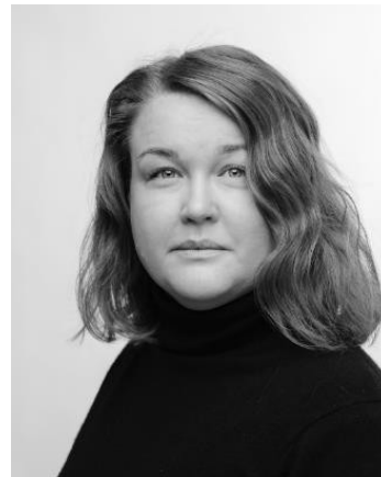
Louise Nordgren Kulttuuri- ja taideohjelma