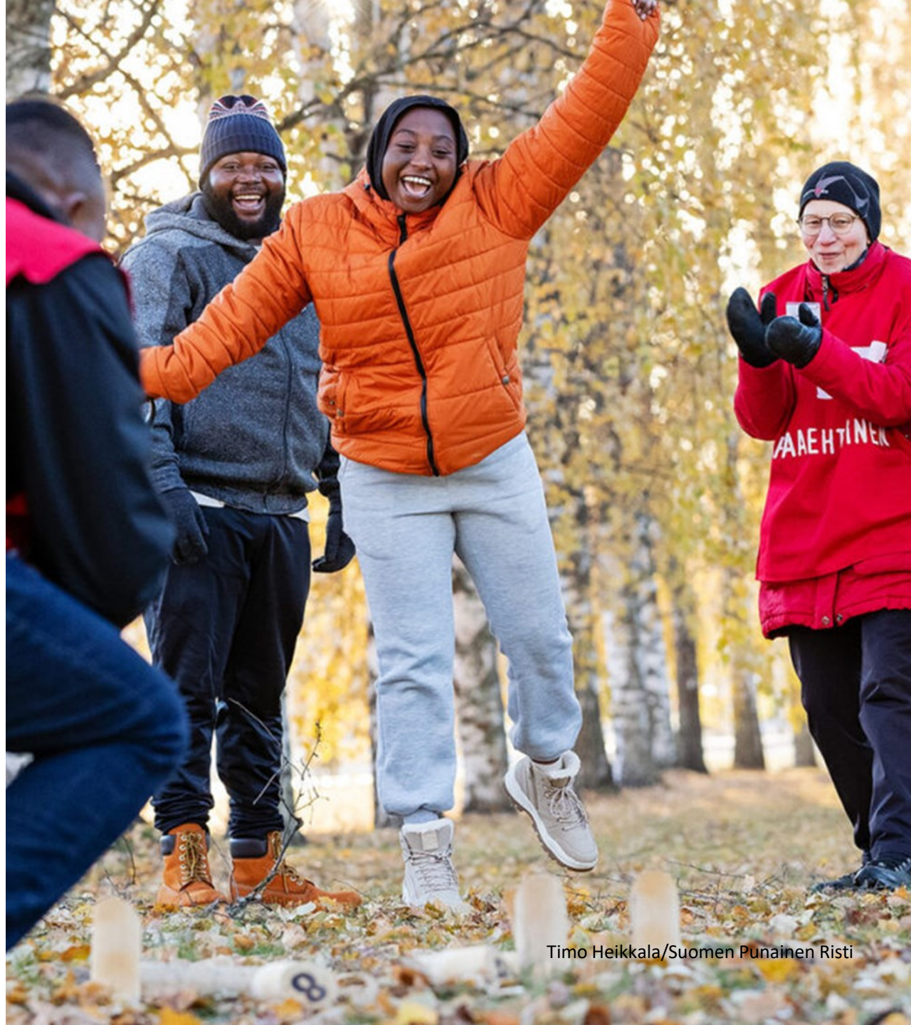
Timo Heikkala/Suomen Punainen Risti